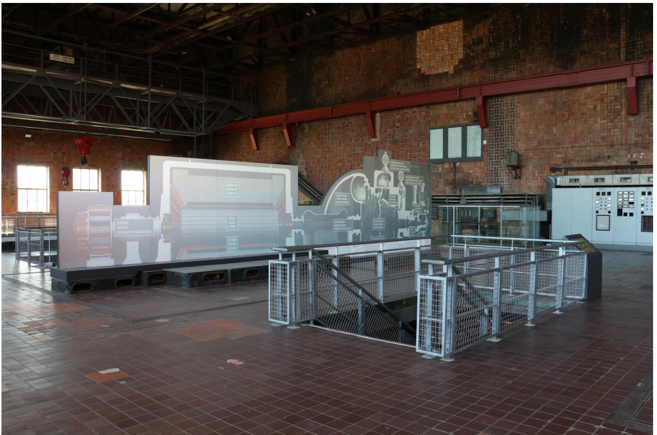
Entwurf der geplanten Visualisierung der Turbine 1 im Museum Peenemünde